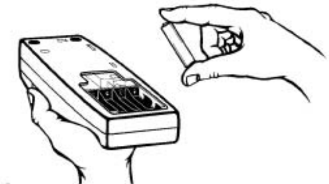
图 3 电池安装

时，请先取下仪器底部的电池盒盖，然后装上电池。在电池盒中已标明了正确的电极顺序。如果电池安装不正确，仪器将可能无法工作。最后，重新盖上电池盒盖。