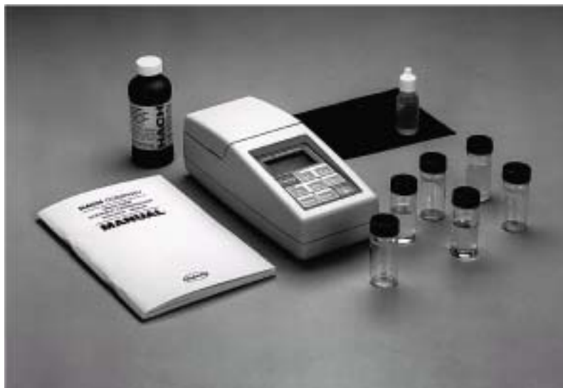
图 1 2100P 浊度仪及其附件

哈希公司 2100P 型便携式浊度仪（图 1）在自动选择范围模式（自动选择小数点位置）下，测试浊度范围为 0.01-1000 NTU。手动选择范围时，可在三种范围下测试浊度：0.01~9.99、10~99.9 和 100~1000NTU。主要设计用于现场测试，但基于微处理过程的 2100P 浊度仪也有许多实验室仪器所具有的测试范围、准确性和分辨率。仪器操作时使用四节 AA 电池或使用可选择的整流器。也可使用镍-镉充电电池，但不能在仪器中对电池充电。如果 5.5 分钟内没有按下键盘，仪器将自动关闭（不影响操作）。如果发生这种情况，只要重新打开仪器即可—2100P 浊度仪将继续工作，好象电源没有断开一样。仪器、所有标准附件和可选择的整流器都可以方便地放在便携式仪器箱中。